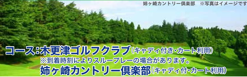
姉ヶ崎カントリー倶楽部 ※写真はイメージです

コース:木更津ゴルフクラブ(キャディ付き・カート利用) ※到着時刻によりスループレーの場合があります。 姉ヶ崎カントリー倶楽部(キャディ付・カート利用)