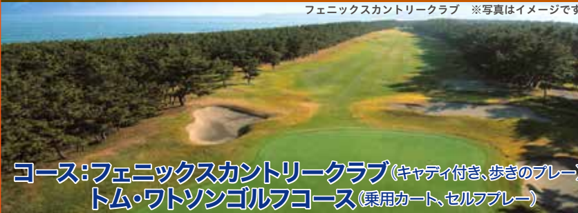
フェニックスカントリークラブ ※写真はイメージです

コース:フェニックスカントリークラブ(キャディ付き、歩きのプレー) トム・ワトソンゴルフコース(乗用カート、セルフプレー)