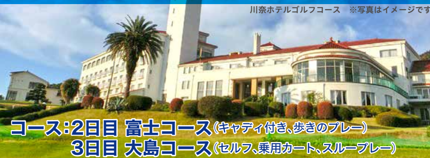
川奈ホテルゴルフコース ※写真はイメージです

コース:2日目 富士コース(キャディ付き、歩きのプレー) 3日目 大島コース(セルフ、乗用カート、スループレー)